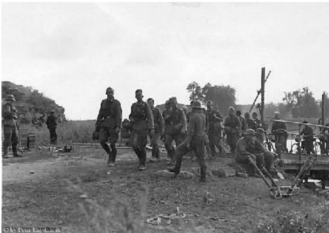
Bataillons Stab auf dem Vormarsch. Übergang über einen Nebenfluss der Luga.