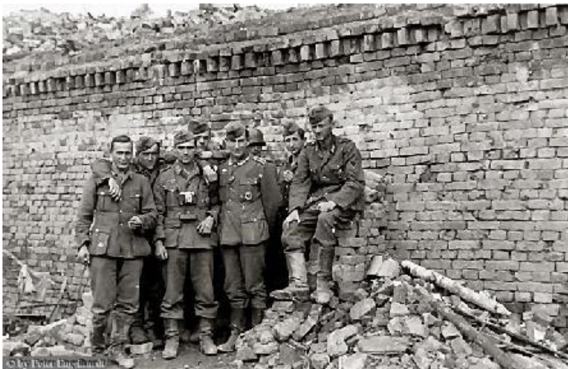
Melderstaffel BataillonsGefechtsStand Sept. 1942