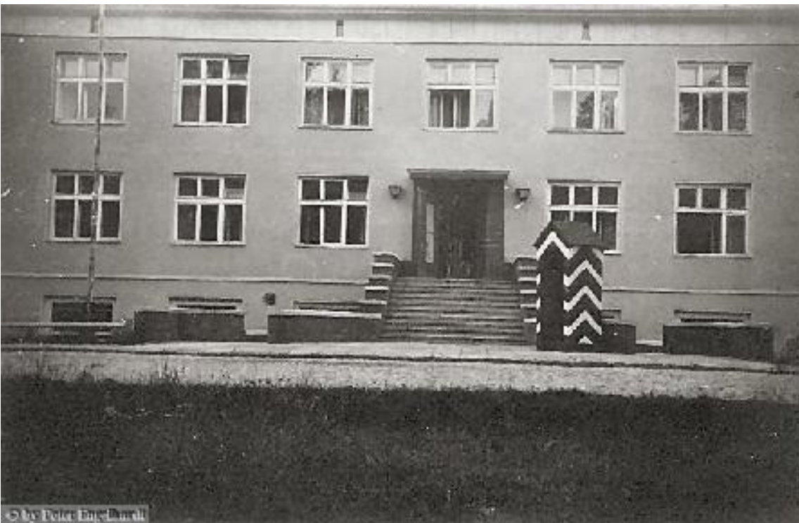
Soldatenheim in Deba