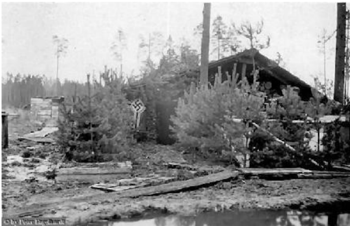
BataillonsGefechtsStand Krasni Bor Okt. 1942