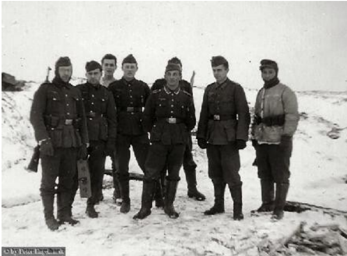
Meine Zweite Gruppe. Dez. 1943