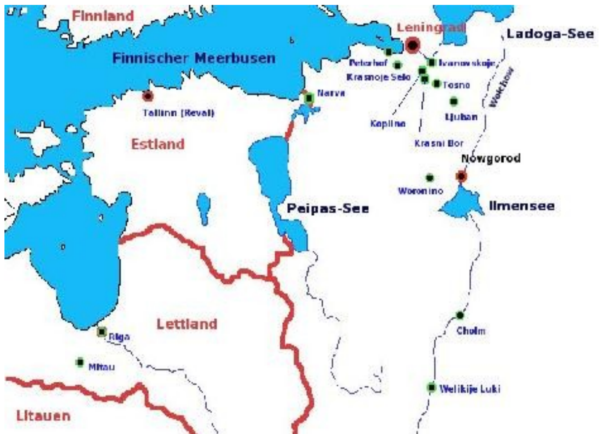
Karte 1941/1944: Ingermanland (schwedisch) oder Ingria (englisch) verlor seine kurze Unabhängigkeit nach dem 1. Weltkrieg und ging im LeningradOblast auf.