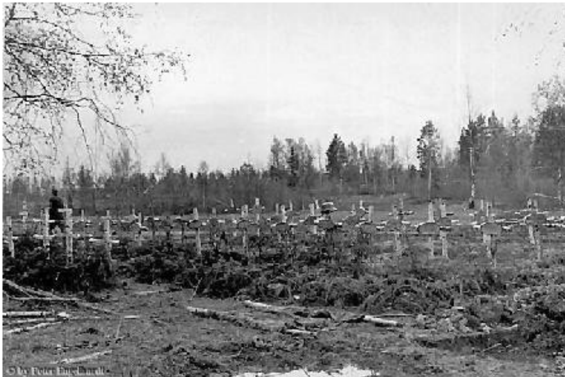
Regiments Friedhof am Wolchow