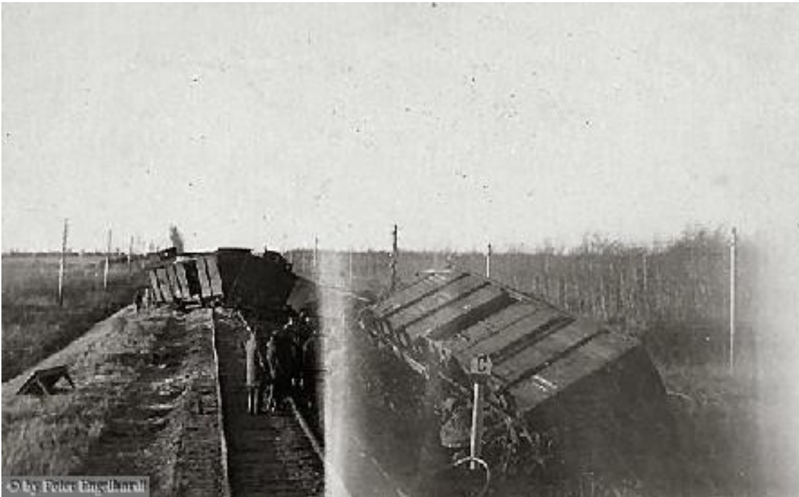
Fahrt Richtung Cholm. Sprengung unseres Zuges Okt. 1942