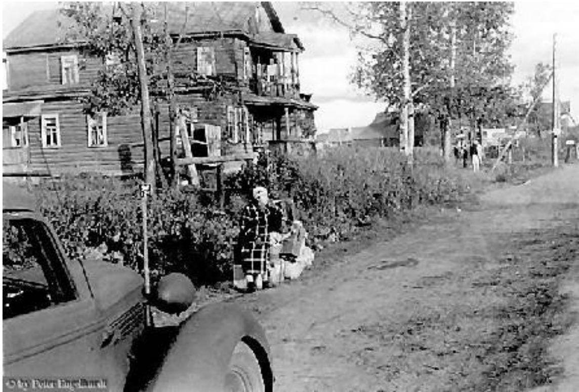
Krasni Bor. Okt. 1942